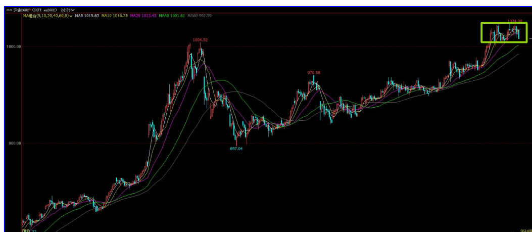
图 2 黄金价格出现滞涨

从炒作的阶段来看，白银逼近20的整数关口，黄金尽管近期出现涨势，但涨势不强，短期甚至出现滞涨情况，这都对贵金属的炒作气氛带来显著压力。